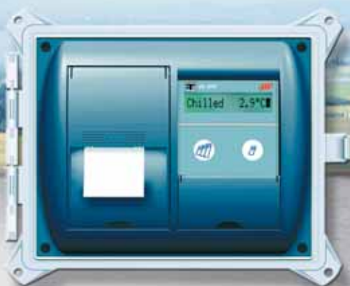
TKDL-SPR Model T

Einfaches und kostengünstiges Datenlogger und Druckersystem