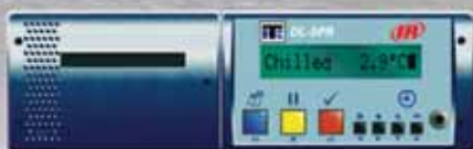
TKDL-SPR Model R