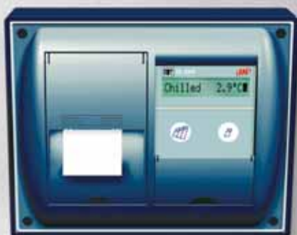
TKDL-SPR Model C